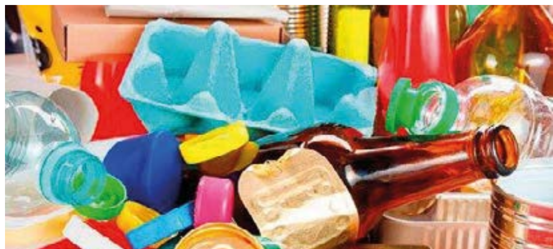
Separe corretamente os reciclados