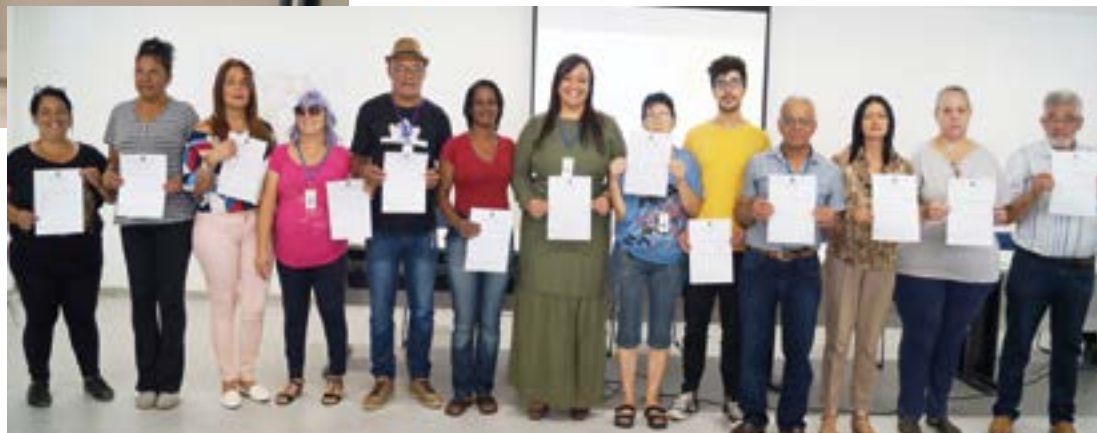
Posse do novo Conselho Participativo

Obras de drenagem e de correção em áreas de risco de deslizamentos e enchentes, reformas de unidades de saúde, regularização de ocupações, criação de áreas ambientais, como a do Morro do Cruzeiro, ampliação de áreas de wi-fi gratuito, requalificação de calçadas, com acessibilidade para pessoas com deficiência física e visual, melhorias e ampliação de ciclovias. Estas foram algumas das propostas apresentadas pela Secretaria de Desenvolvimento Urbano,